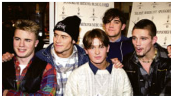
Take That 1993: Gary, Howard, Mark, Robbie, Jason (v. l.)