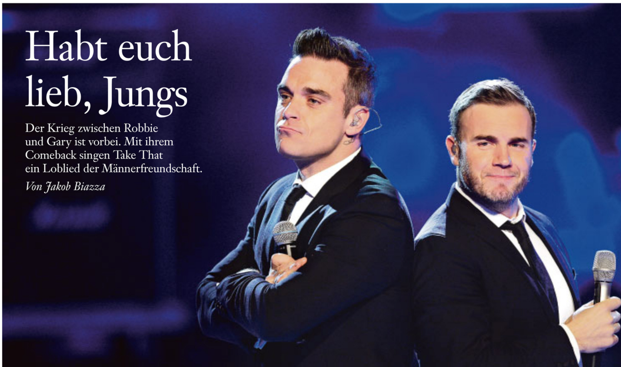
Miteinander singen ist einfacher, als miteinander zu reden: Robbie Williams (l.) und Gary Barlow zelebrieren ihre Wiedervereinigung auf der Bühne in Köln.